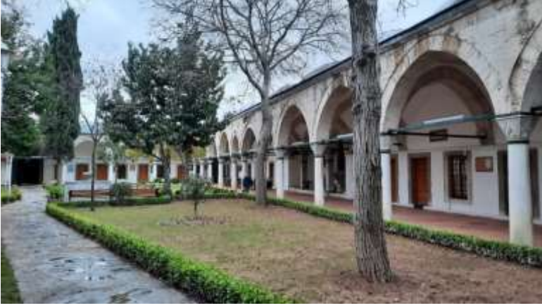
Şekil 5. Medrese avlusu, kuzey cephesinde revaklar ve hücreler, batı yönünde servi ve hücreler. (Ayşe K. Yavuz)

Caminin kuzeyinde yer alan medrese, külliye'nin batısında bulunan kapıdan içeriye girildiği anda insana kendisini başka bir âlemde, dünyanın dışında bir mekânda hissettiren huzur dolu bir avluya sahiptir. Çalışmanın başında yer alan planda görüleceği üzere, inşa edilen alanı baz alarak yamuk şekilde inşa edilmiş olan medresenin doğu cephesi batı cephesinden daha kısadır. 18 odası ve bir dershanesi (büyük salon) bulunmaktadır. Bu odalardan ikisi doğu cephesinde ve dördü batı cephesinde yer almaktadır. 15 öğrenciye göre tasarlanmış bir medresedir. Medrese odalarının önünde bulunan, pandantif kubbelerle örtülmüş revaklar kemerlerle sarılıdır ve baklavali başlıklı mermer sütunlar tarafından desteklenmektedir (Yılmaz, 2001). Medresenin güney duvarı cami avlusu ile arasında bir istinat duvarı görüntüsü oluşturmakta, bu cephede oda bulunmamaktadır. “Revaklardaki hücreler ise, avluya bakan birer adet pencereye ve kapıya, dışarıya bakan ikişer tepe penceresine, ayrıca ocak ve dolap nişlerine sahip olup, burada okuyan talebelere, müderris ve hizmetlilere tahsis edilmiştir” (Gülcan, 2019). Medrese avlusunun ortasında bugün bir süs havuzu görüntüsü oluşturan muhtemelen daha önce şadırvan olarak kullanılan bir yapı bulunmaktadır. Avlunun girişindeki servi, baki dünyayı hatırlatan taş yapıya sonsuzluğu simgeleyen görüntüsüyle eşlik etmektedir.