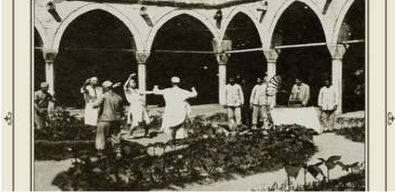
Şekil 6. Bimarhane döneminde avluda hastalar.

nedeni ile süreli olarak birkaç kez Toptaşı Bimarhanesi'nde tedavi gördüğü bilgisi mevcuttur.