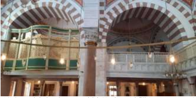
Şekil 4. Caminin batı kısmı ve girişi, Hünkâr Mahfili (Ayşe K. Yavuz)

Güney cephenin üst pencereleri de ferforje işçilikle hazırlanmış metallerle renklendirilmiştir. Dönemin yükselen değeri İznik çiniciliğinin başarılı örnekleri olan renk ve teknikler, caminin süslenmesinde kullanılmış, mihrap ve pencere alınlıklarına yerleştirilen panolar XVI. yy'a ait sıraltı tekniği ile hazırlanmıştır. (Kılıç, 2017). Caminin batı ve doğu kısımlarına sonradan eklenen alanlar üstteki iki resimde yer almaktadır. Pandantif iki ikişer kubbe ile oluşturulan bu alanların birleştiği noktalarda yer alan mermer sütunların üzerinde mukarnaslı başlıklar bulunmaktadır. Kubbelerde yer alan kırmızı tonlardaki kalem süslemeleri dikkat çekmektedir. Camiyi kaplayan cıvıtlı havası kubbe eteklerine işlenen çiçekli desenler ile şenlendirilmiştir. Kubbelerin gövdesinde, uçları düğümlü şemseler sıralanmış, şemselerin içinde dallar üzerinde karanfil, şakayık, lale çiçekleri yapraklarıyla birlikte simetrik olarak resmedilmiştir (Nemlioğlu, 2003).