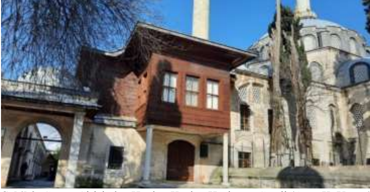
Şekil 2. Güney Girişinden Hünkar Köşkü, Hazire ve Camii (Ayşe K. Yavuz)

Şadırvanın solunda ve sağında bulunan çardaklar da bu kaynaşmaya ortaklık etmekte ve avluda bir temaşaya imkân sunmaktadır.