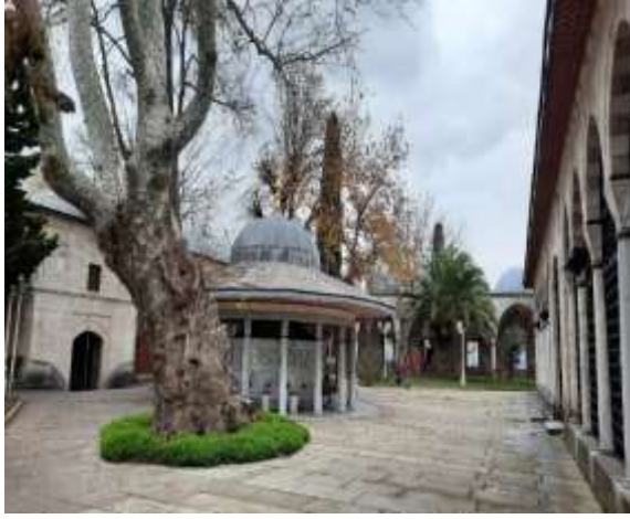
Şekil 3. Batı girişi tarafından avlunun görünümü, sütunlu şadırvan ve çınar (Ayşe K. Yavuz).

Eklenen kubbeli alanlar sayesinde oluşan iki katlı kenar alanların alt katları alçak tavanlı oda görünümlü bölümler oluşturmuş, bu tavanlar ahşap işçilik ile süslenmiştir.